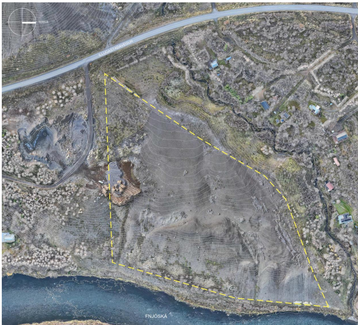
Mynd 1. Skipulagssvæði deiliskipulagsins er afmarkað með gulri línu.